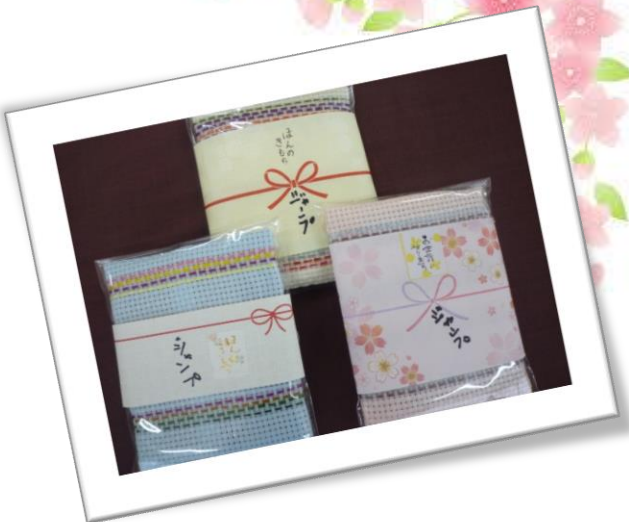
ベストセラー商品 刺繍ティッシュケースです。