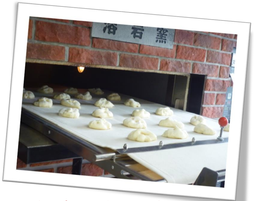
ジャンプのパンの美味しさの秘密は この落岩窯にあり！